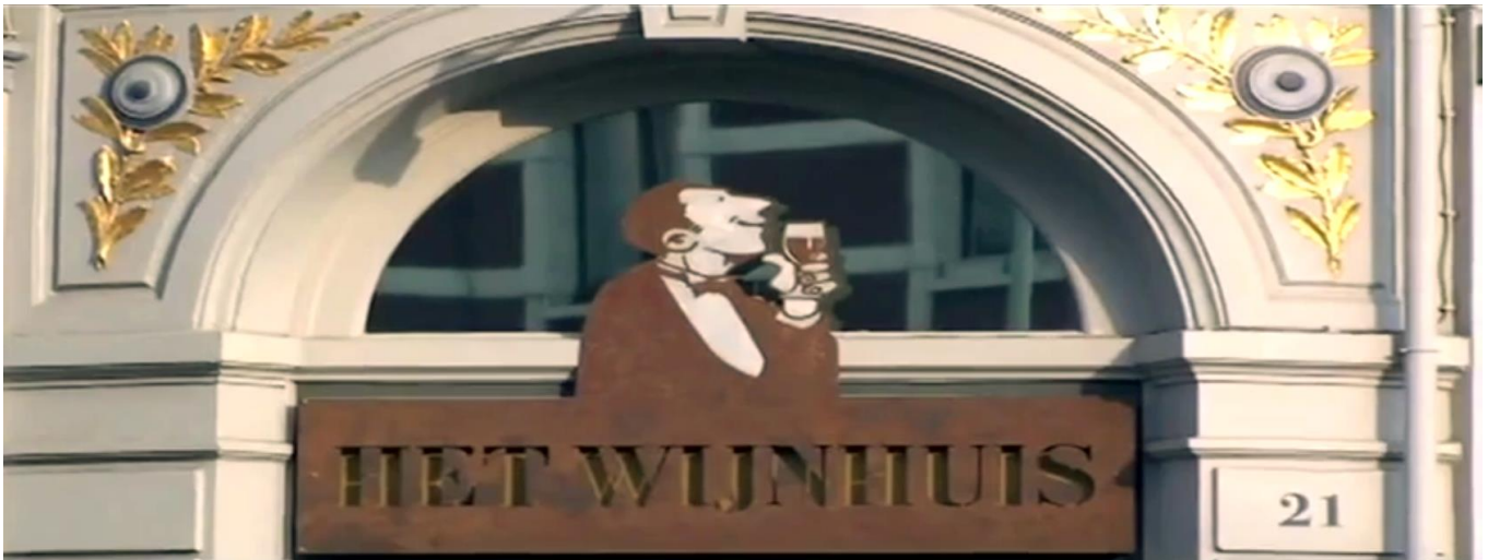
Het Wijnhuis Antwerpen

In maart 2014 heeft het Wijnhuis een Wincor Nixdorf Beetle iPos+ aangeschaft als wijnkiosk voor haar klanten. De Sunrise eKiosk toepassing is web-based, volledig HTML5, responsief en maakt gebruik van het lokale geheugen van de browser zodat de eKiosk kan blijven werken indien de internet verbinding verloren gaat.